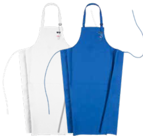
Nantou - 8195A2FK0