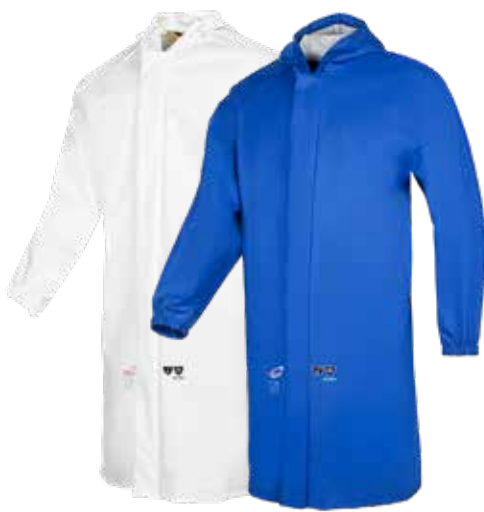
Rigi - 4415A2FK0