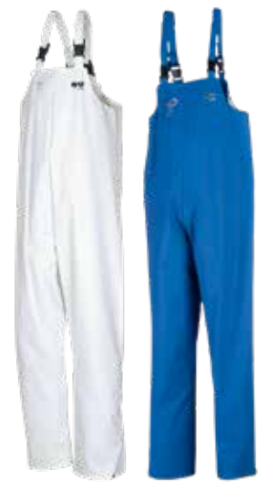
Killybeg - 6639A2FK0