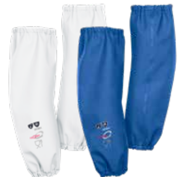
Cork (Kleen) - 8161A2FK0