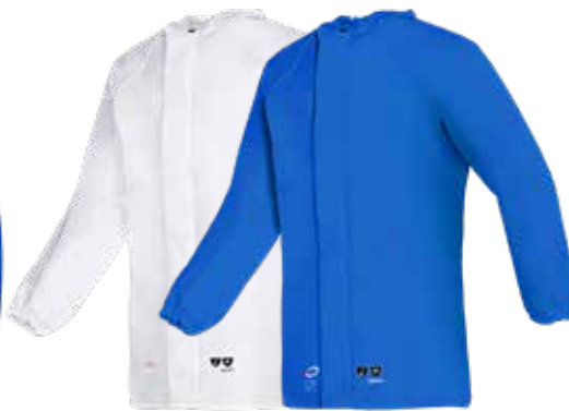
Morgat - 4391A2FK0